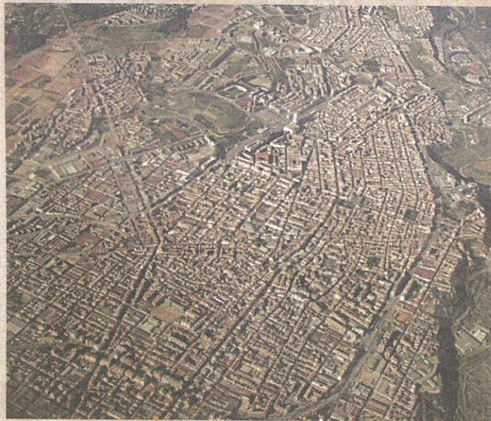
Panoràmica aèria de Sabadell

«Barcelona va poder endreçar la seva vessant litoral amb les Olimpíades perquè a més d'un projecte tenia un instrument institucional, l'an-